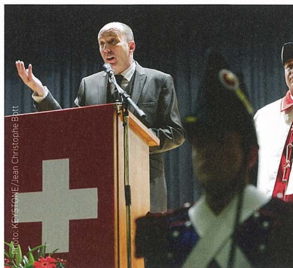
Fraîchement élu Président du Conseil National, Germanier s'adresse aux habitants de Vétroz.